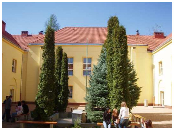
Dziedziniec V LO w Zielonej Górze