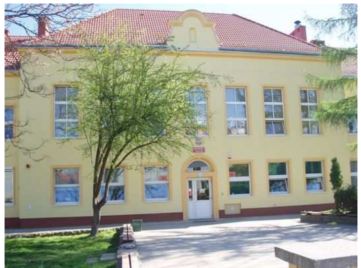
V LO im. K. Kieślowskiego w Zielonej Górze