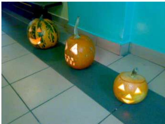
Dynie straszące w czwartkowy wieczór