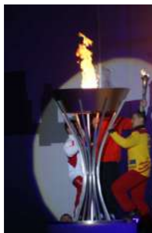
Płomień olimpijski towarzyszący zmaganiom sportowym

Zapraszamy do udziału w warszawskim konkursie Mediatorro przeznaczonym dla gimnazjalistów i licealistów. Uczniowie muszą wykazać się kreatywnością podczas redagowania działań mediatora w konfliktach realnych, zmyślonych lub między postaciami komiksowymi. Prace mogą być nadsyłane w formie pisemnej graficznej, bądź audiowizualnej. Każdy otrzymuje nagrody ufundowane przez Empik School, a nagrody główne to iPhone 3G i kursy językowe. Prace trzeba oddać do 5 stycznia. Więcej informacji na www.mediatorro.pl