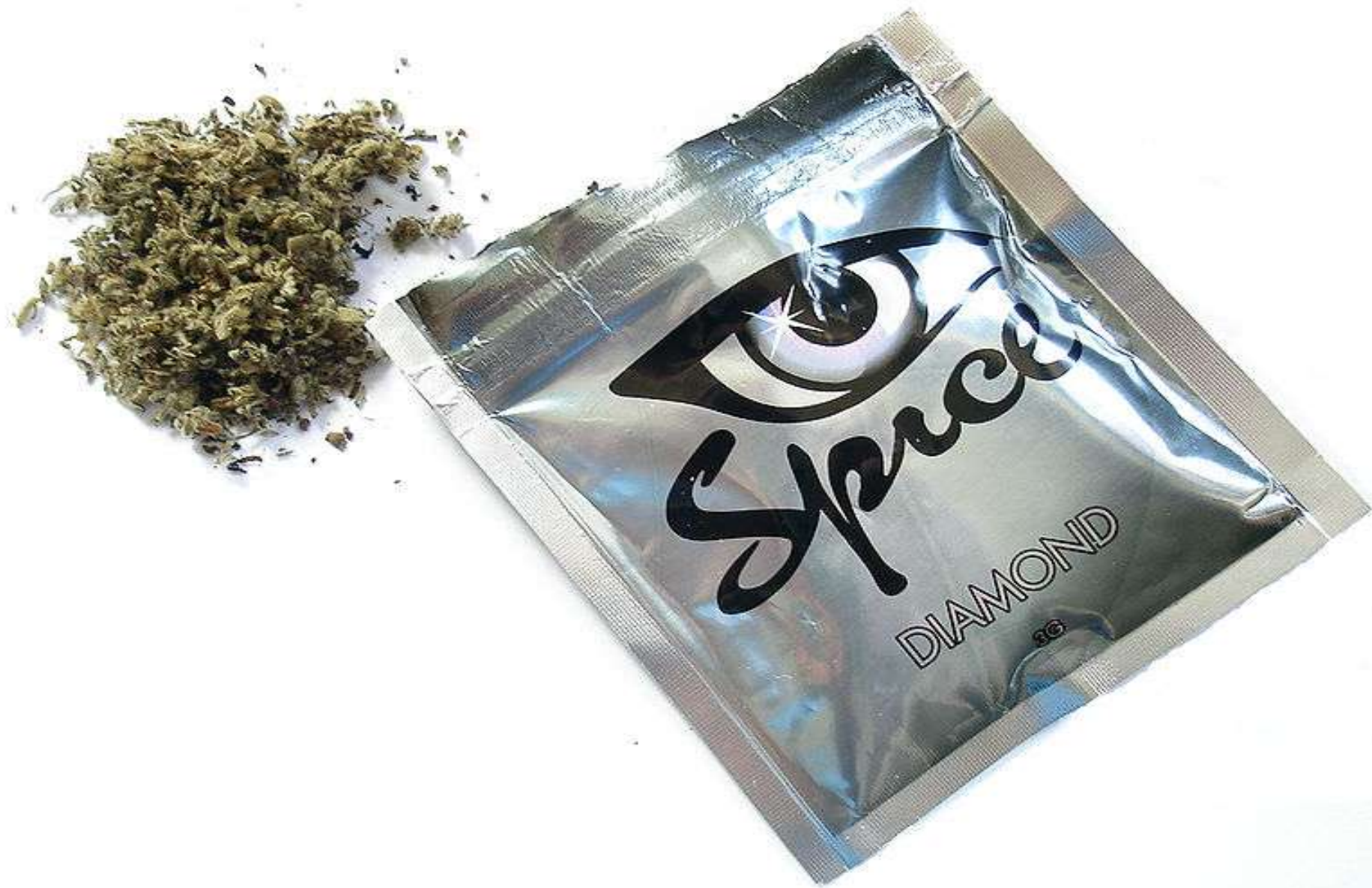
Opakowanie jednego z produktów typu Spice - Spice Diamond