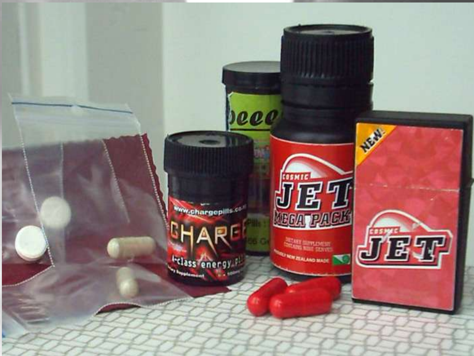
Przykładowe formy party pills, zawierających BZP, sprzedawanych w Nowej Zelandii