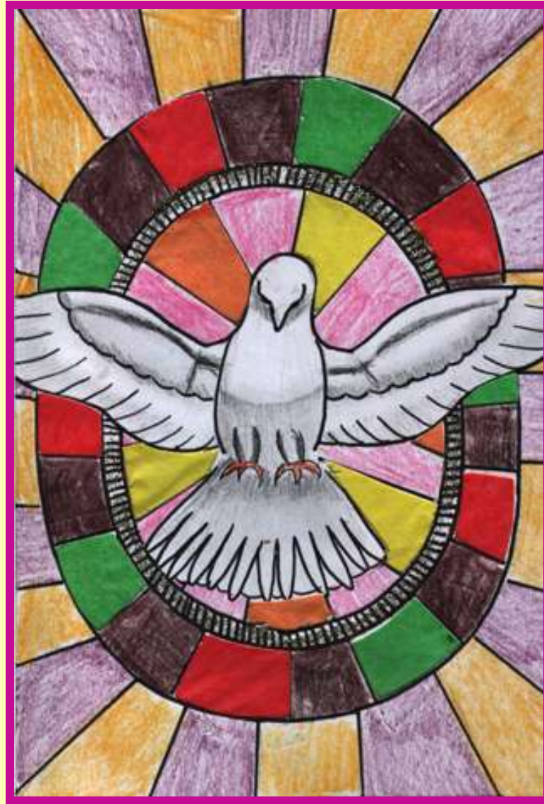
Projekt okładki Biblii: Gabrysia Głowacka kl. III d