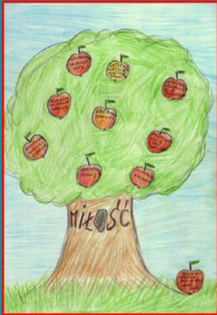
HUBERT OSTASZEWSKI KL III B