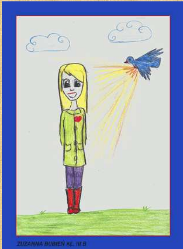
Rysunek: Zuzanna Bubień kl. III b